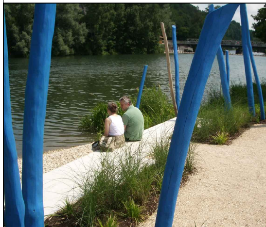
Sitzen an der Brigach