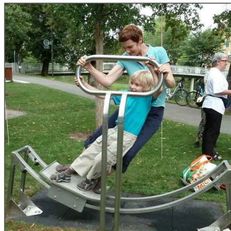
Motorikgeräte für Jung und Alt