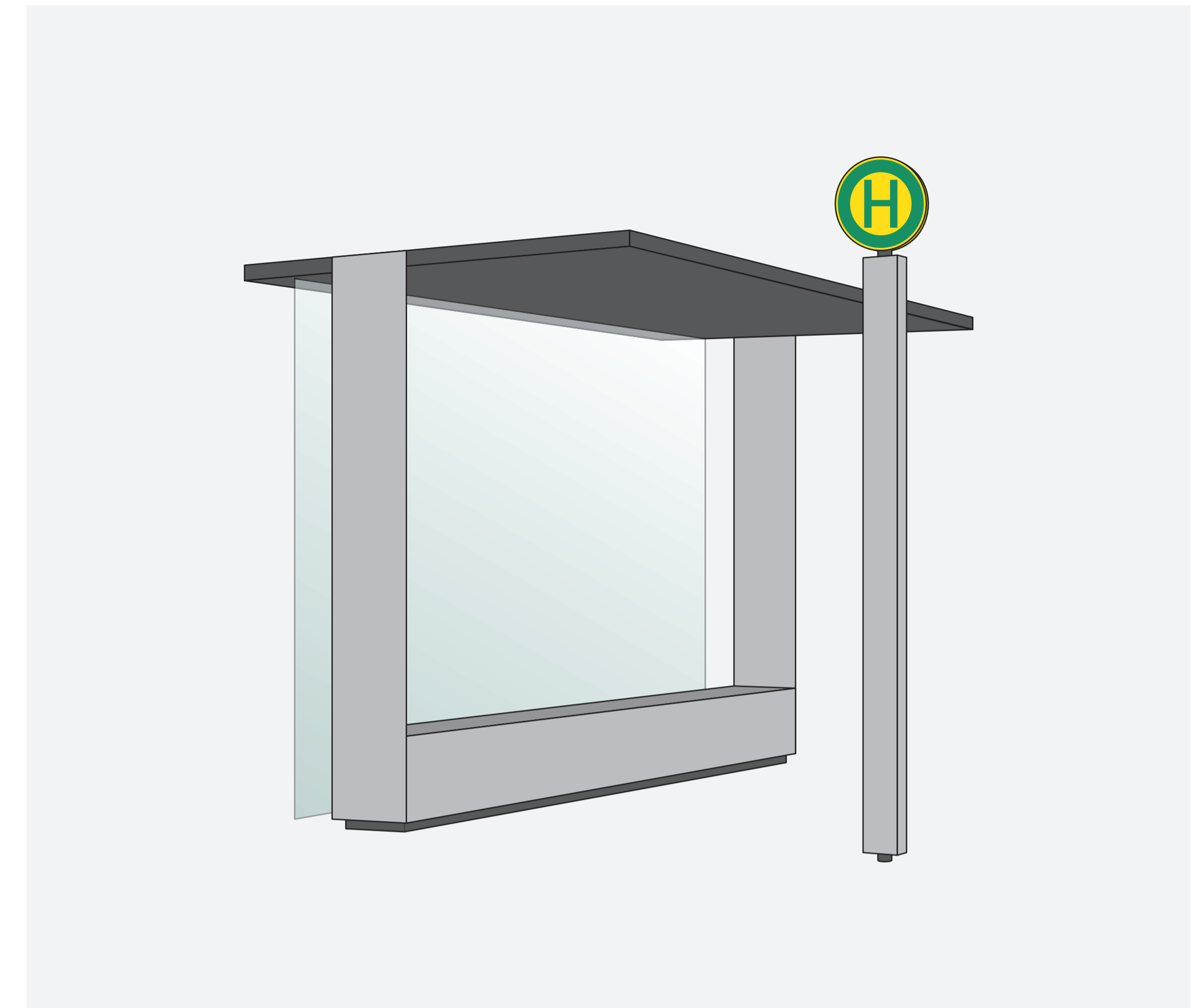
Haltestellen mit Unterstand

Die Materialität und Ausführung ist Gegenstand eines Arbeitsprozesses mit den Verantwortlichen vor Ort.