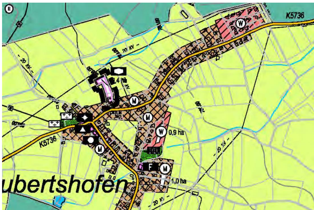
Bild: Auszug aus dem FNP 2020, 2. Änderung

Ein bislang in dem Stadtteil vorgesehenes kleineres Baugebiet hat sich infolge mangelnder Mitwirkungsbereitschaft der betroffenen Eigentümer nicht entwickeln lassen. In Hubertshofen fehlt es an verfügbaren Bauflächen. Die im ausgewiesenen FNP dargestellten Bauflächen konnten bisher, trotz großer Anstrengungen, nicht aktiviert werden.