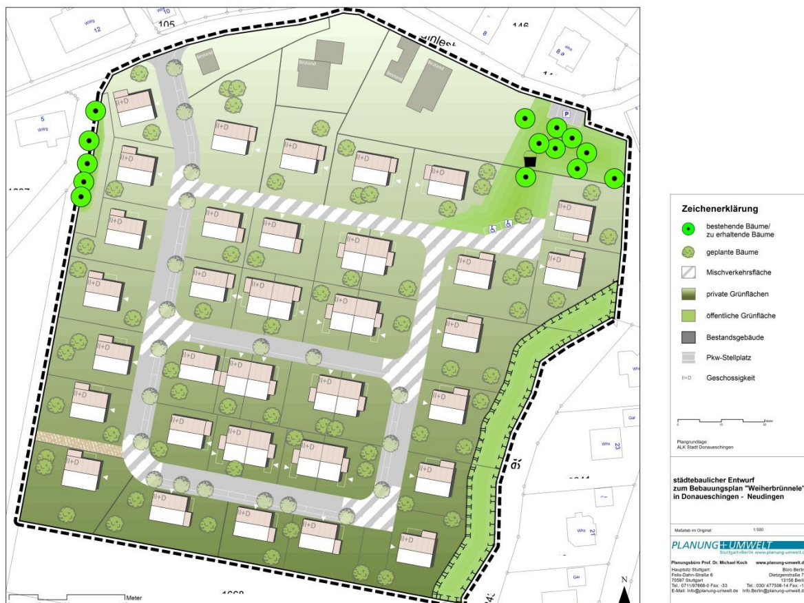
Abbildung 4: Städtebauliches Konzept zum Bebauungsplan –Stand 16.11.2020

Zur Sicherung des vorhandenen Baumbestands werden öffentliche Grünflächen z.T. mit Pflanzbindung festgesetzt. Die öffentliche Grünfläche am nordöstlichen Rand des Baugebiets dient darüber hinaus der Freizeitnutzung und als Kinderspielplatz. Die öffentliche Grünfläche als Gewässerrandstreifen entlang des Rainlesbachs dient dem Schutz des Gewässers vor Einträgen und als Ausgleichsfläche.