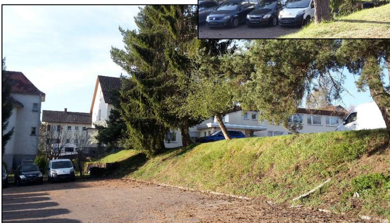
Abbildungen 3 - 5: unbebauter Geltungsbereich