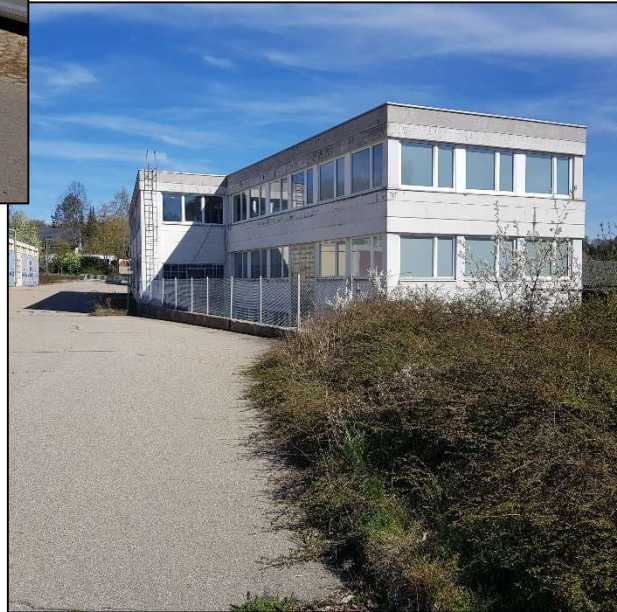
Abbildungen 6 - 11: