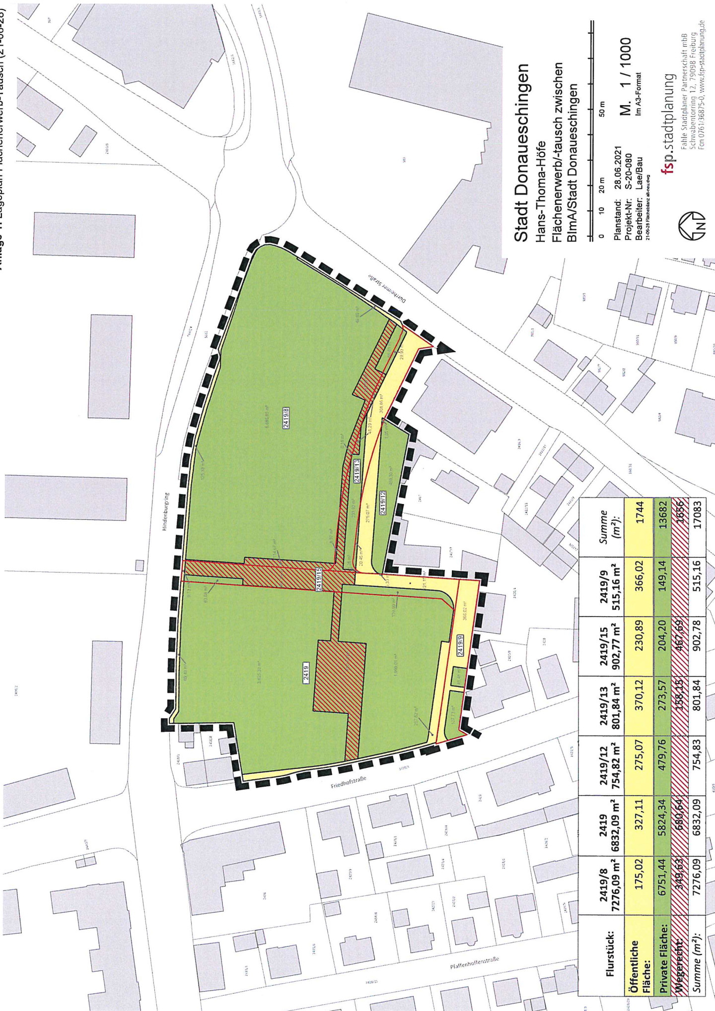
Anlage 1: Lageplan Flächenwerb-Tausch (21-06-28)