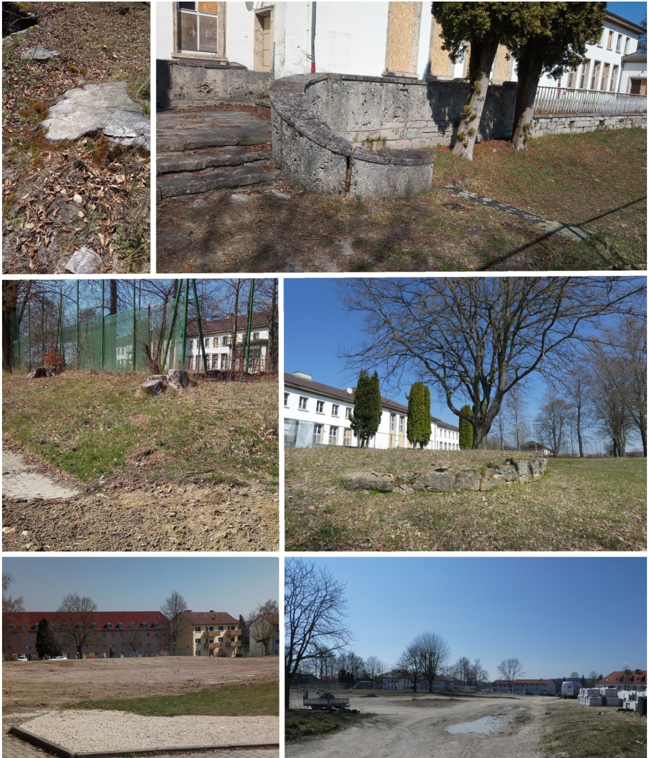
Abb. 2. Eindrücke aus dem Untersuchungsgebiet: Böschung mit Baumstümpfen, Mauerstrukturen, Böschung mit Offenstellen, Mittelalter Baumbestand und Mauerstruktur, großflächige Offenbereiche (von oben links nach unten rechts). Aufnahmen: 02.04.2020