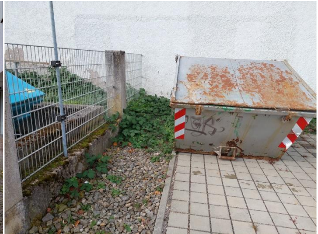
Betonmauern mit Brombeeren auf Schottergärtenflächen im Nordwesten des Plangebiets