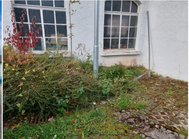
Bodendeckerpflanzen links im Bild, umliegend aufkommende Ruderalvegetation am westlichen Rand des Plangebiets