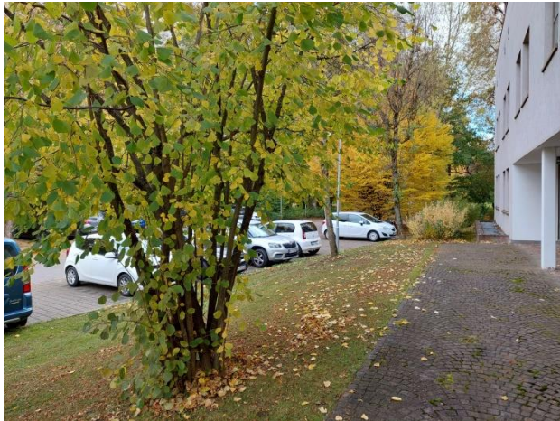
Grünflächen mit einzelnen Sträuchern und Bäumen im Norden des Plangebiets, Blickrichtung Osten