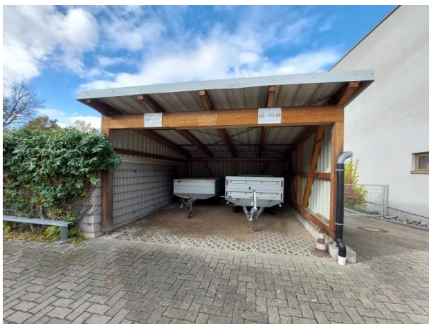
Überdachte Abstellplätze mit Nischen im Bereich der Balken, links im Bild begrünte Mauer im Süden des Plangebiets, Blickrichtung Westen