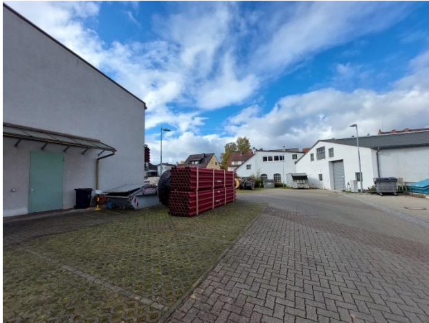
Lagerhalle links im Bild, rechts im Bild an das Plangebiet angrenzende Gebäude, Blickrichtung Westen