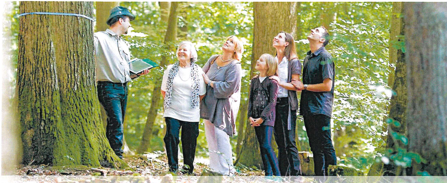
Ein FriedWald-Förster hilft Interessenten bei der Baumauswahl.