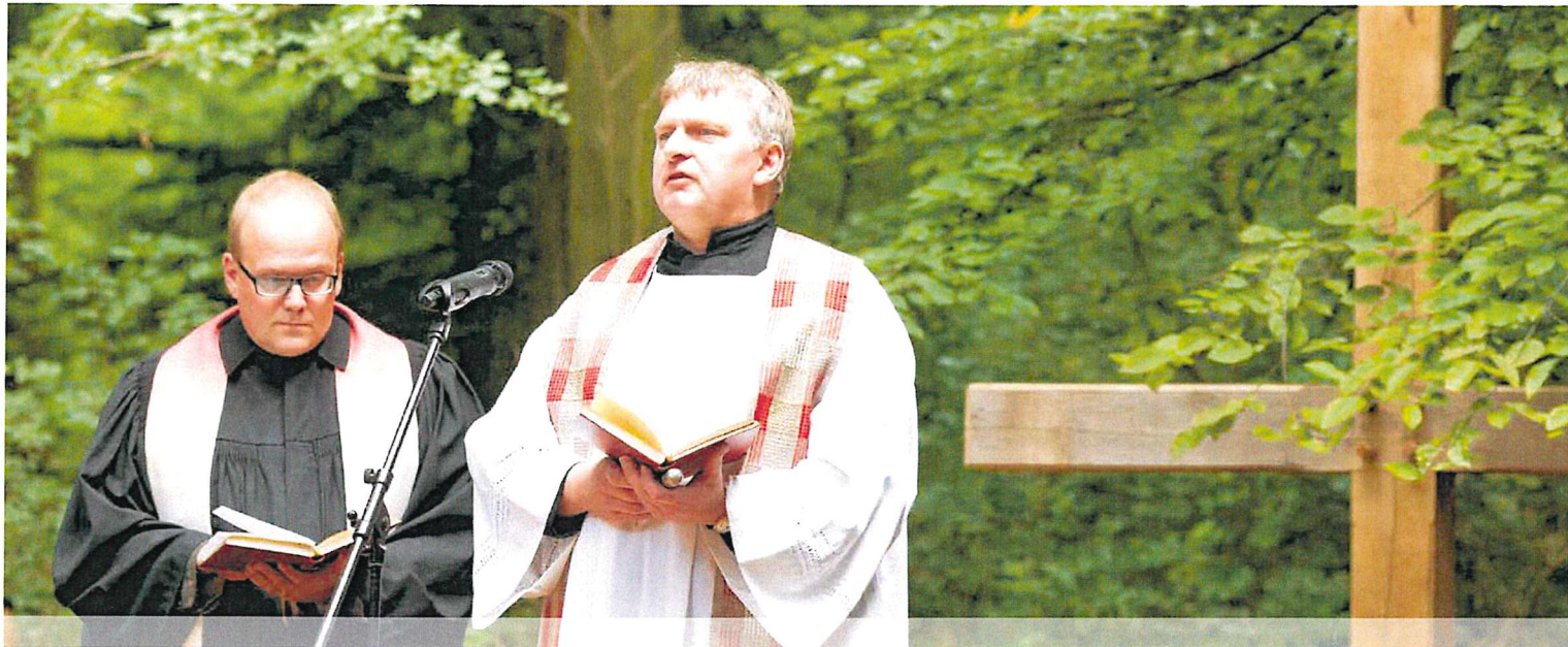
Eröffnungsfeier im FriedWald Schönebeck.