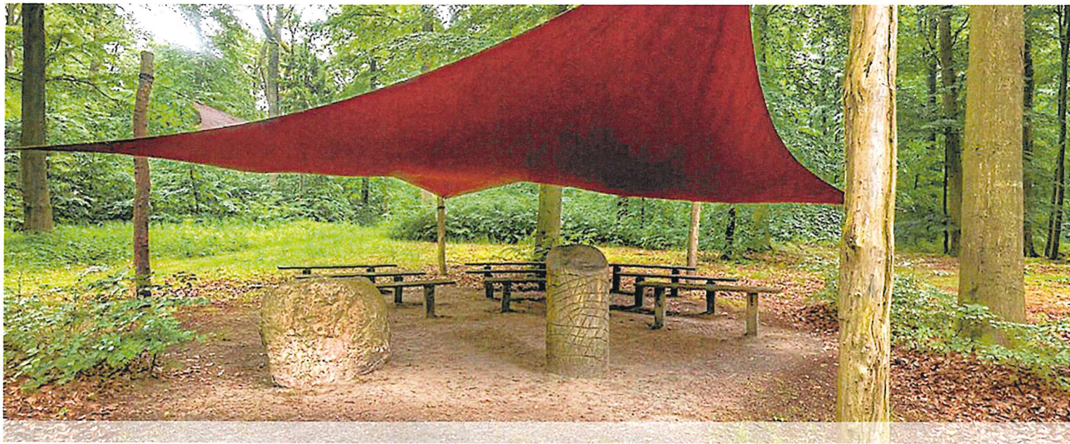
Versammlungsplatz im FriedWald Osteide/Lüneburg.