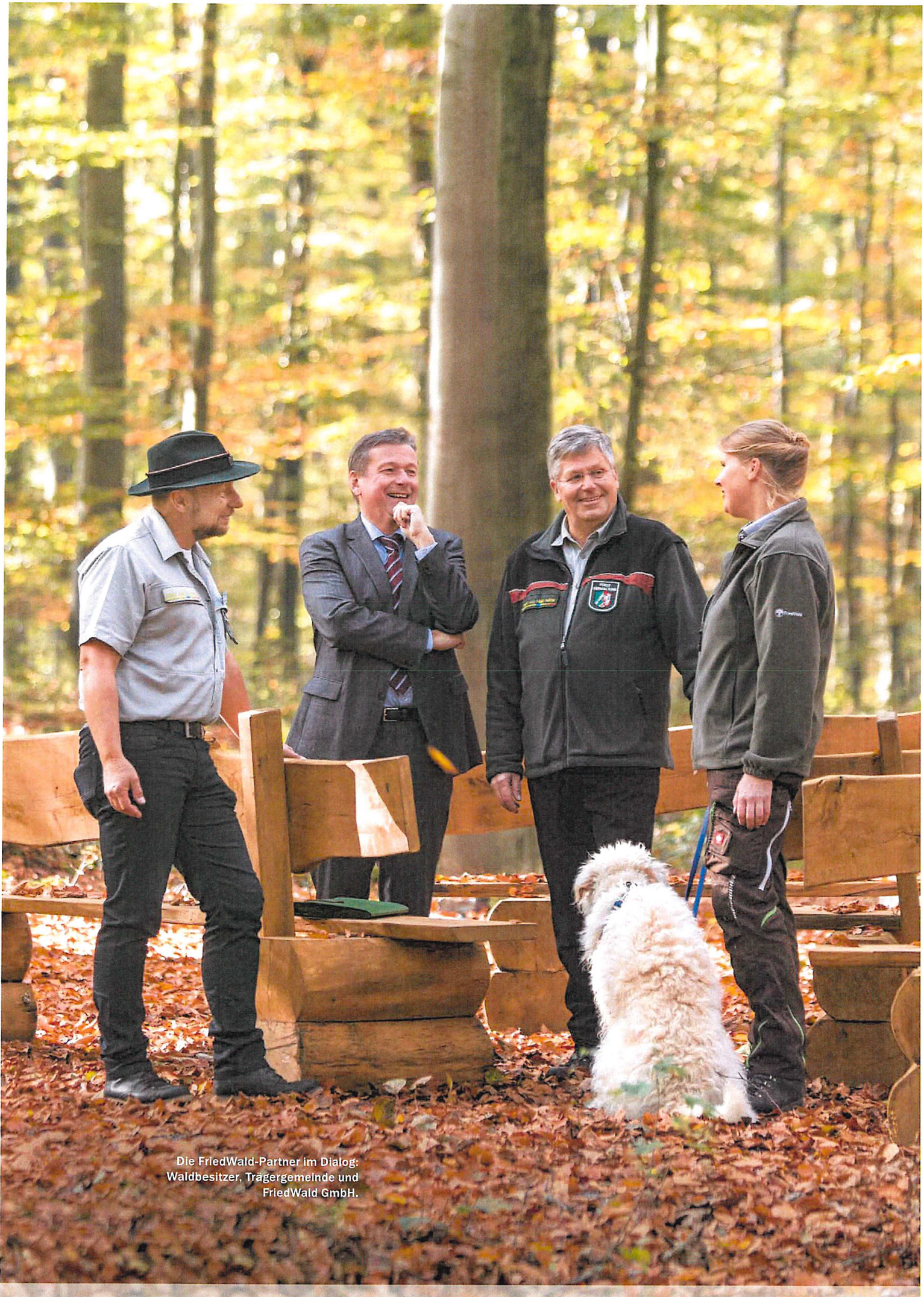
Die FriedWald-Partner im Dialog: Waldbesitzer, Trägergemeinde und FriedWald GmbH.