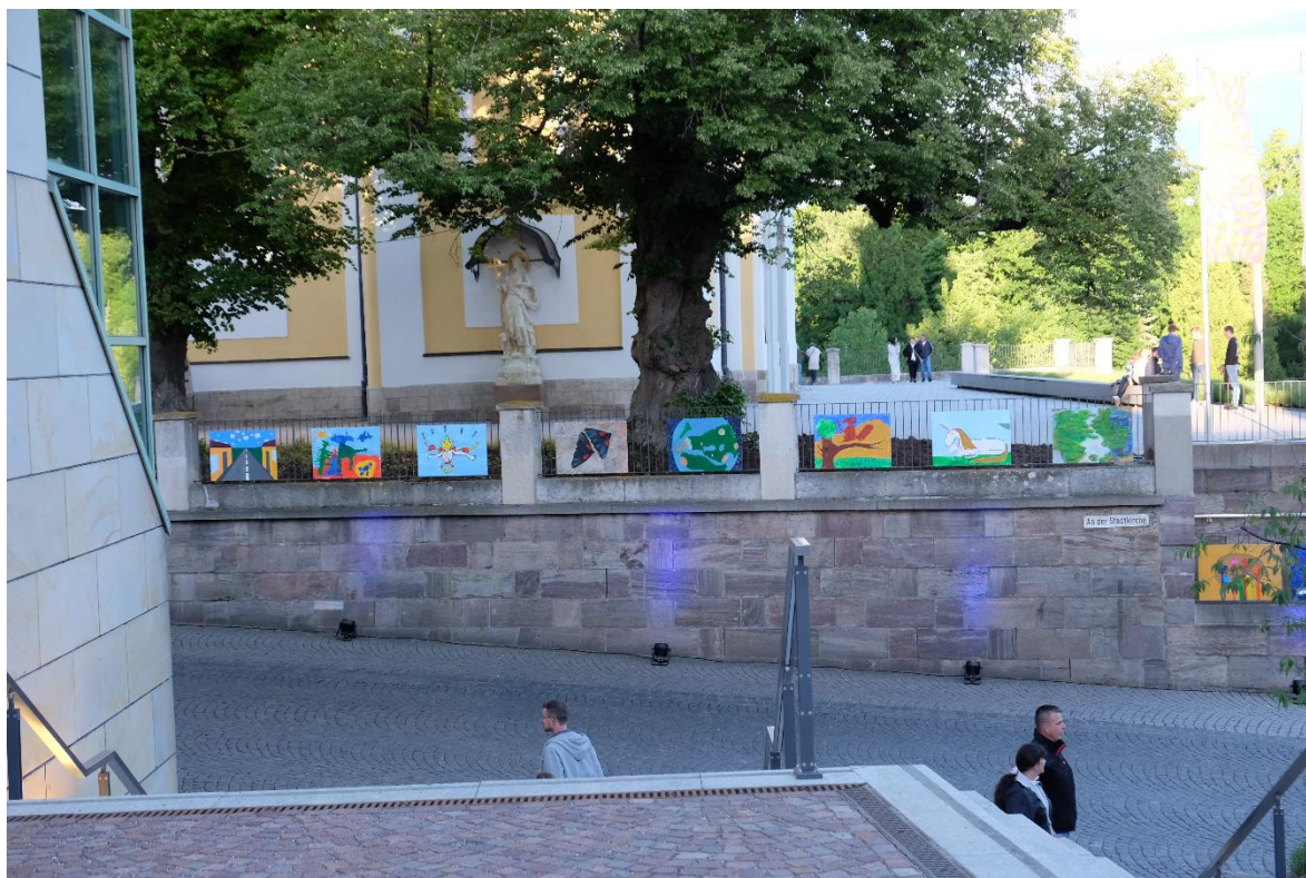
Bilder von Schülerinnen und Schülern der Kunstschule Donaueschingen

Die Kunstschule Donaueschingen beteiligte sich an der Donaueschinger MuseumsNacht am 28.05.2022 und stellte im Residenzbereich Bilder aus. Diese zierten noch Wochen später die Geländer an der Kirche und der Musikschule und erfreuten Einheimische und Touristen.