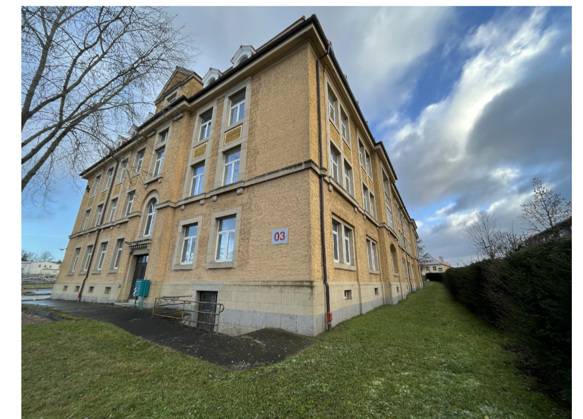
Haus 3 Denkmal Bestand Südwestansicht