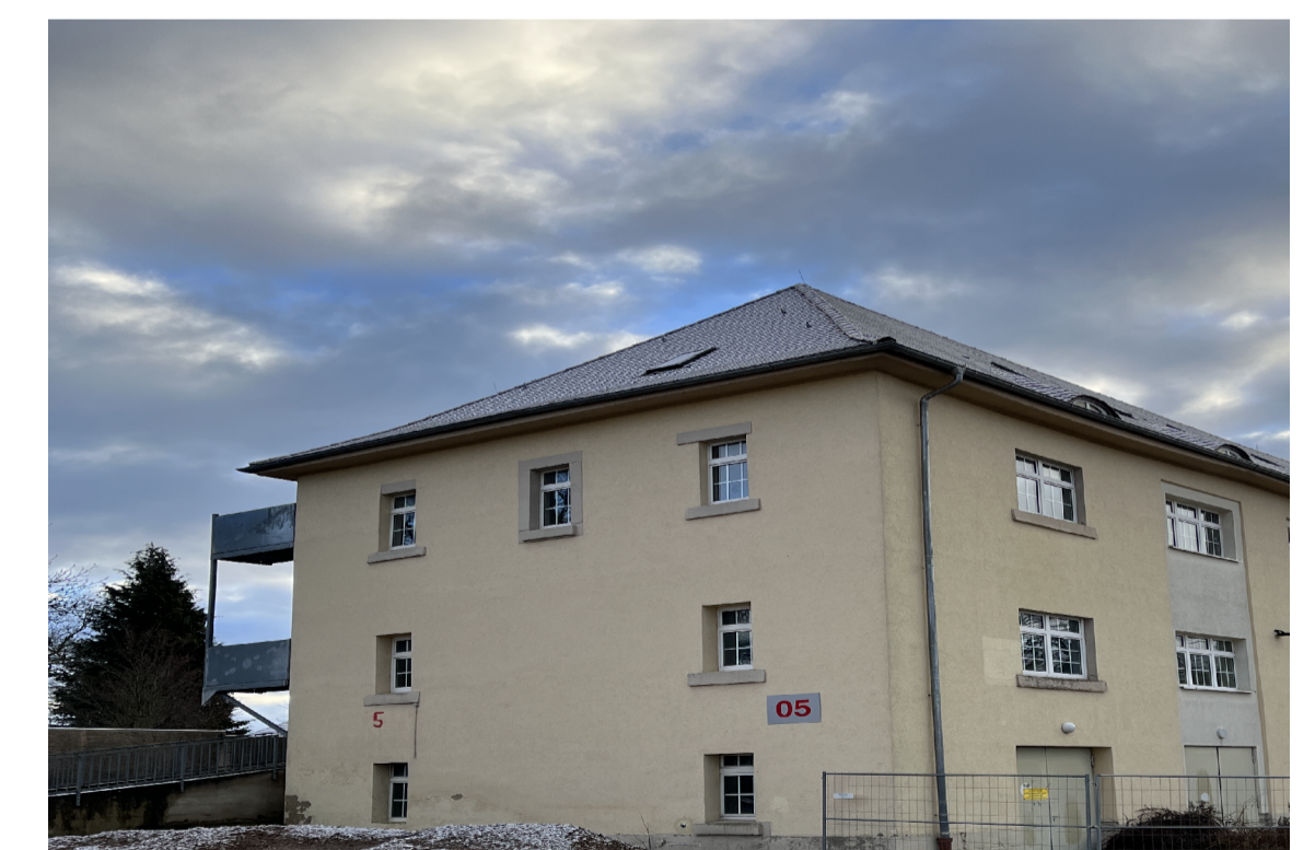
Haus 5 Denkmal Bestand Nordwestansicht