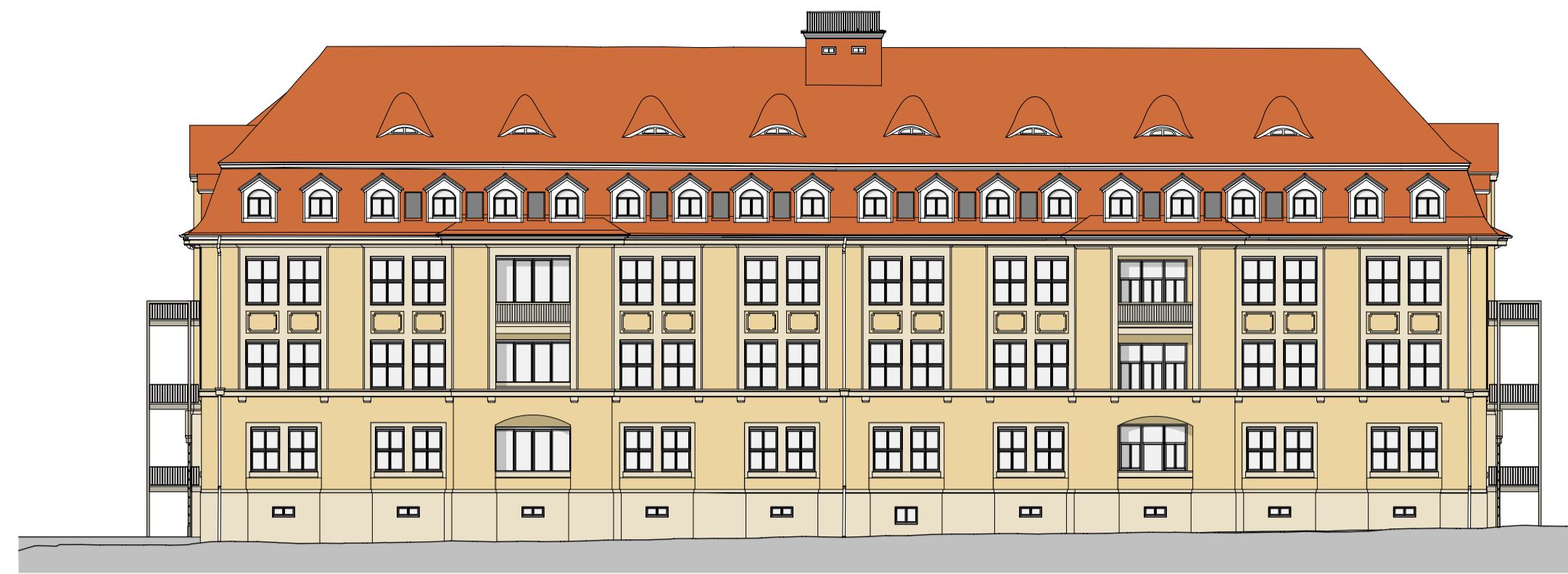
Ansicht Süd Haus 1