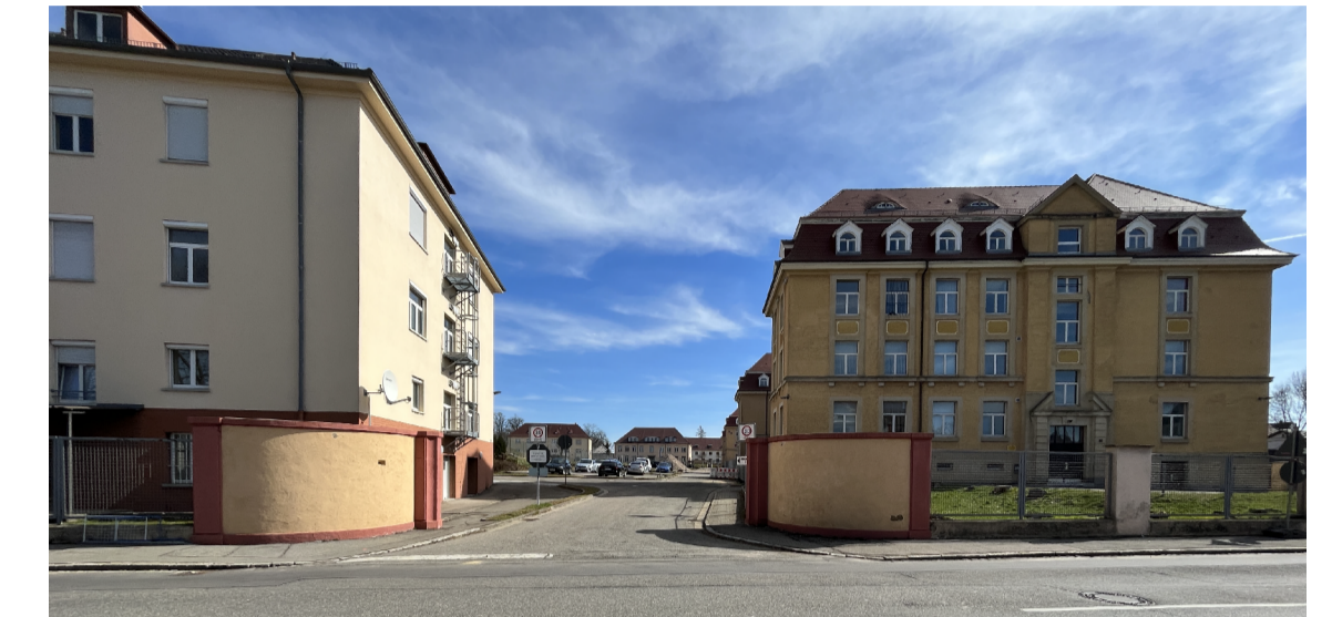
Einfahrt Villinger Straße