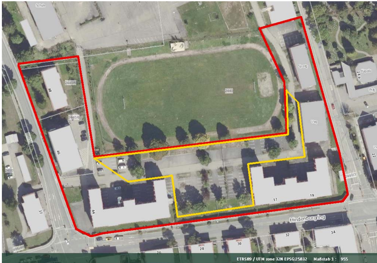
Abb. 1: Geltungsbereich des B-Plans (rot) und Betrachtungsraum für die vorliegende Worst-Case-Analyse (gelb) (LUBW, 2022)