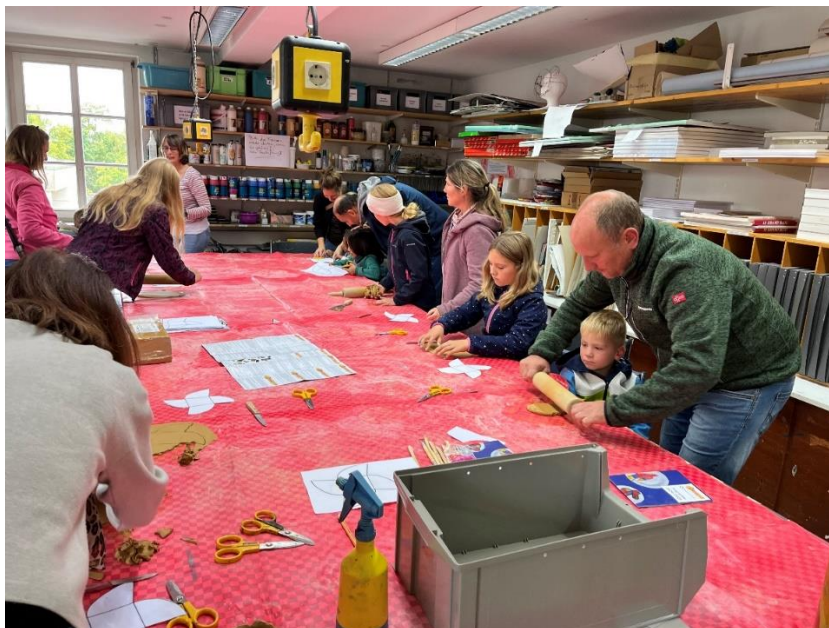
„Tag der offenen Tür“ in der Kunstschule 2024