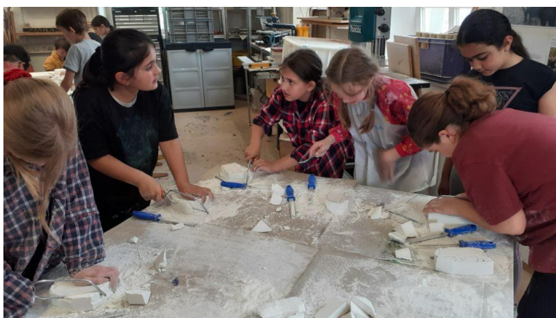
Förderprogramm „Lernen durch die Künste“ Unterricht im plastischen Gestalten

An der Kunstschule arbeiten derzeit eine festangestellte Verwaltungskraft (Leitung der Schule, 100 %) sowie zwölf freie Mitarbeiter. Für das neue Schuljahr 2025/26 konnten wir drei neue Dozenten gewinnen (Modern Dance, Theater und Porzellanmalerei).