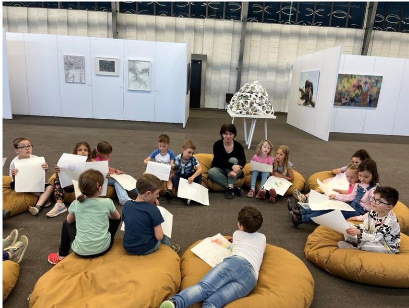
Fünf Kindergärten und die Karl-Wacker-Schule besuchten mit 92 Kindern die Workshops an der „Donaueschinger Regionale“